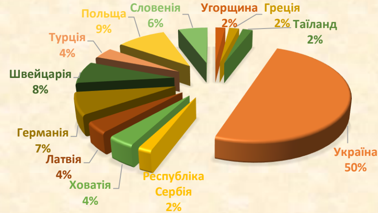
Рис. 1. Аналіз асортименту лікарських засобів на основі пантенолу по країнах-виробниках